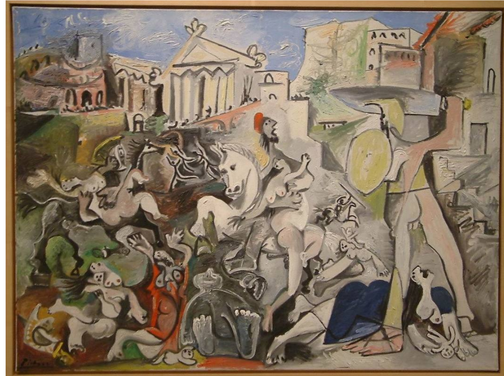
Remake de P. Picasso, 1964-1965