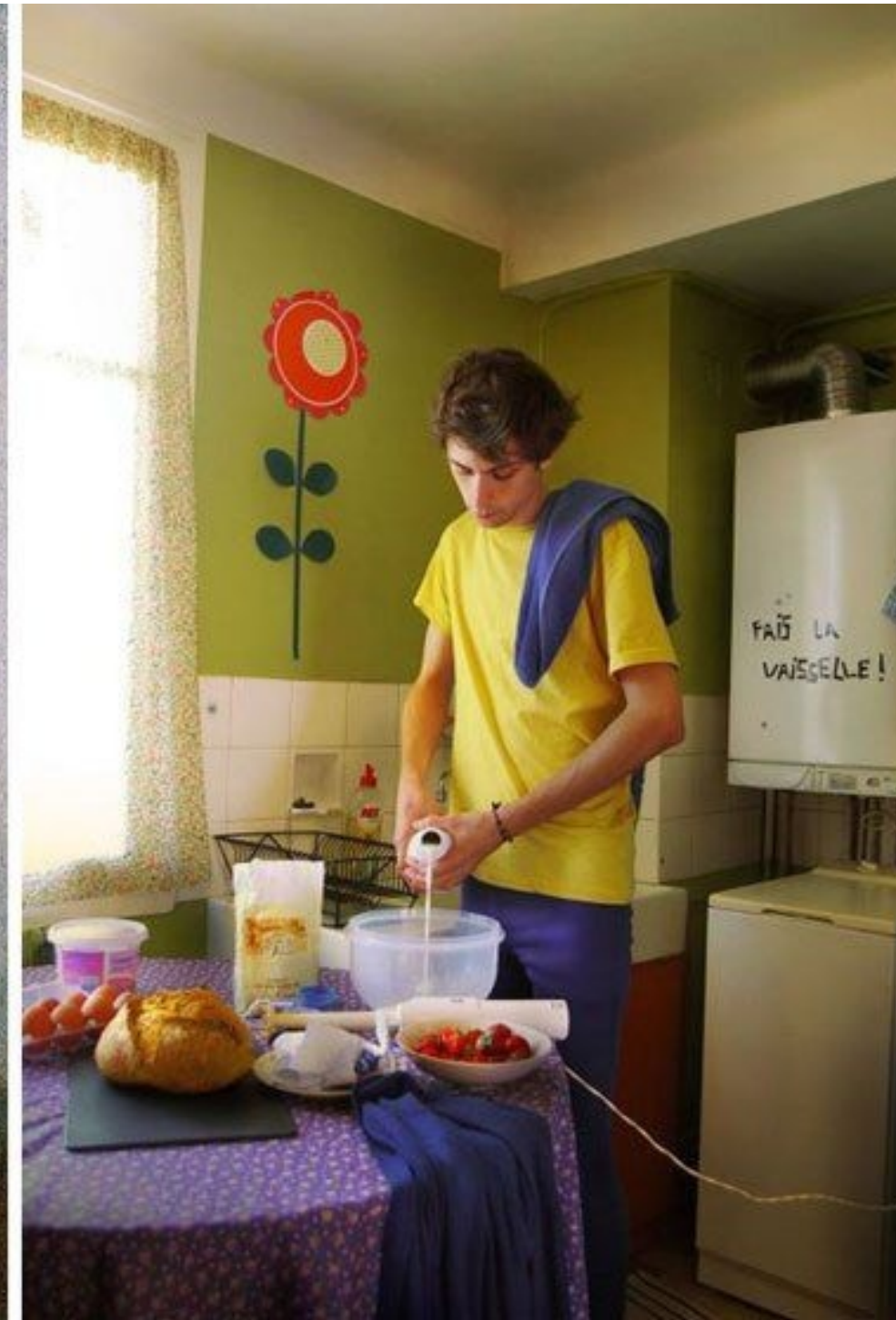
Remake de Justine Rioufrait, 2017