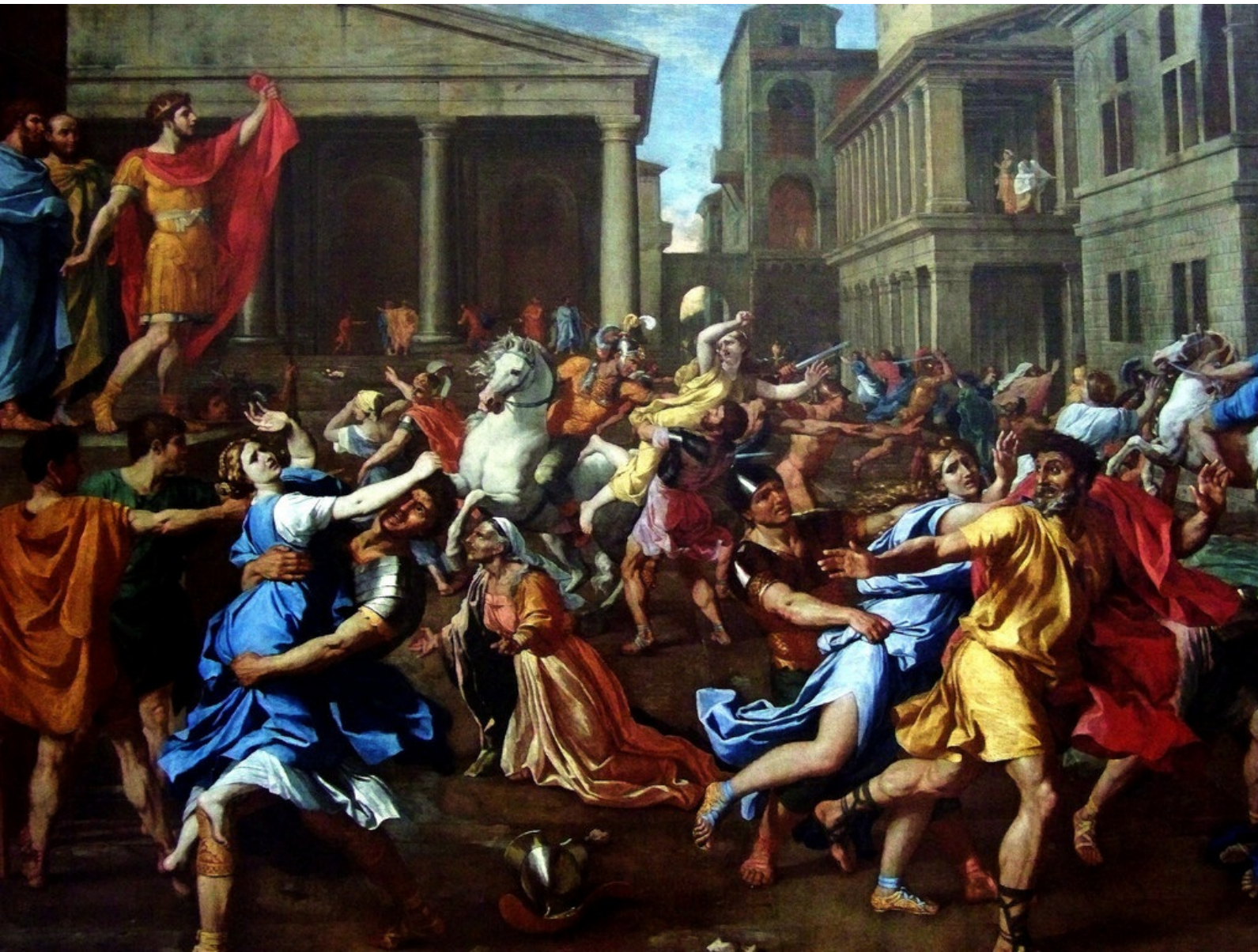
Peinture originale de N. Poussin, 1634-1635