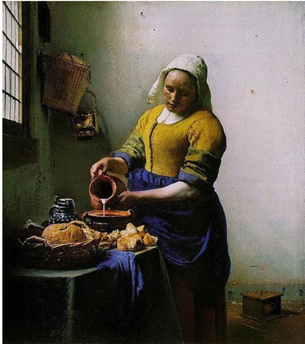
Peinture originale de Johannes Vermeer, 1658